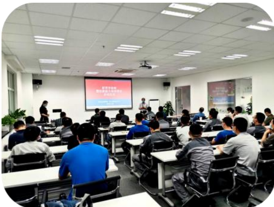
图 13 企业技能提升培训