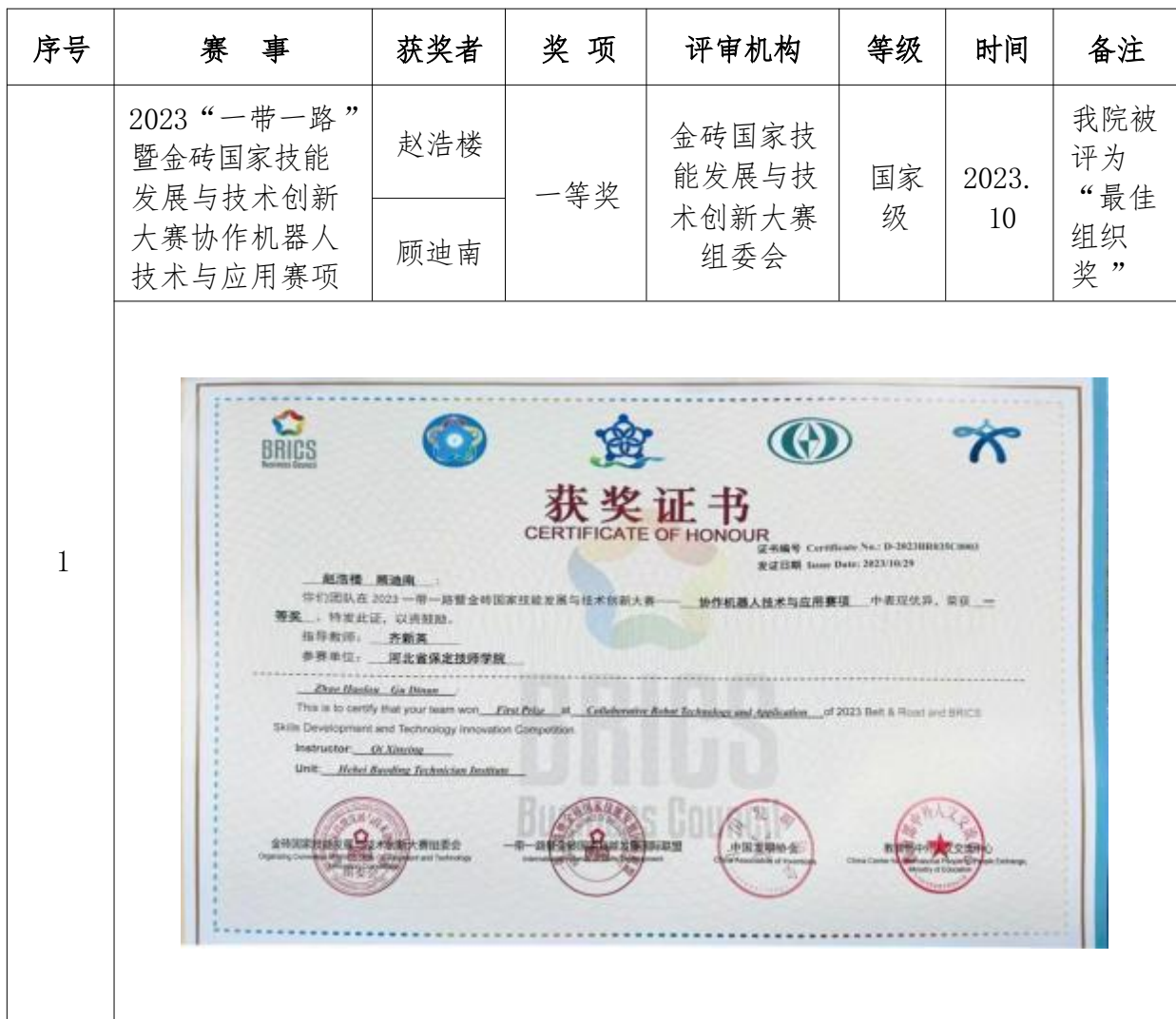
表 7 教师大赛情况汇总表

师赵浩楼、顾迪南荣获国赛一等奖，学院也凭借出色组织揽下“最佳组织奖”。这些亮眼成绩背后，是学院坚持以赛促教、以赛促改、以赛促发展的有力彰显，为培养高素质技能人才筑牢根基。教师及学生大赛情况如表 7 教师大赛情况汇总表、表 8 学生大赛情况汇总表所示：