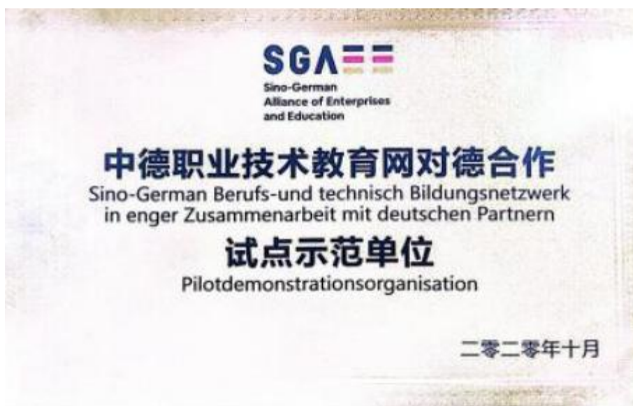
图 16 对德合作试点示范单位