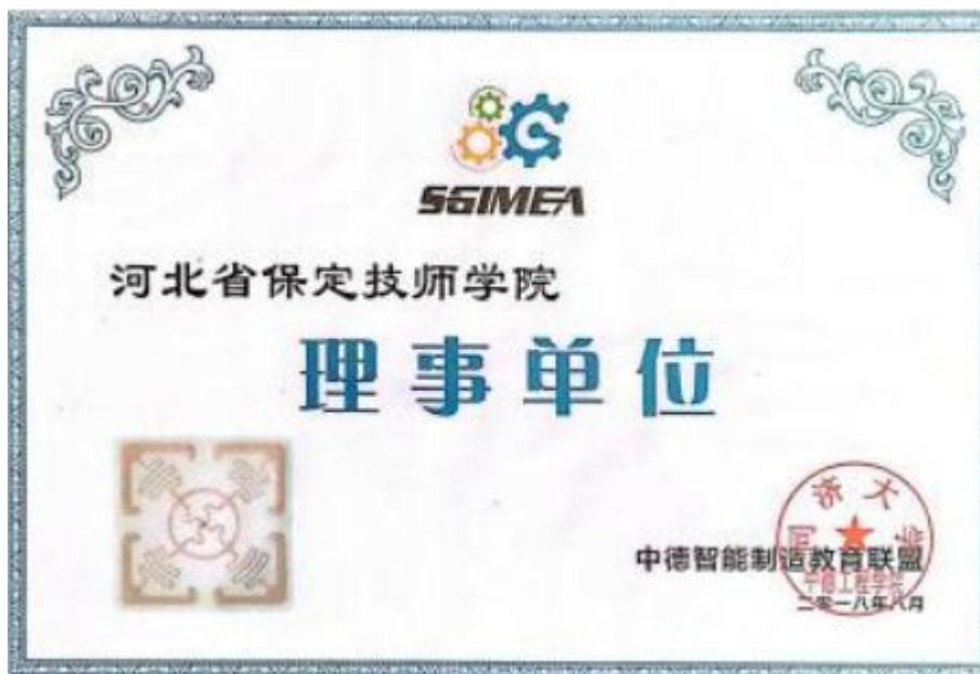
图 18 中德智能制造教育联盟理事单位