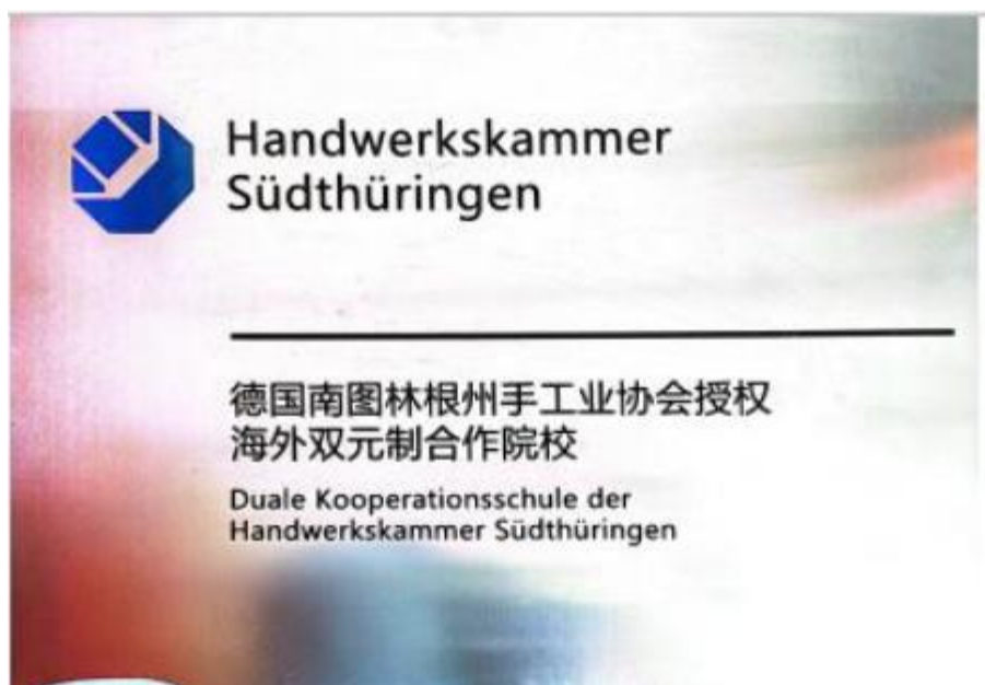
图 14 双元制合作院校

保定技师学院已与德国西门子（中国）签约，成为西门子智能制造工程人才认证首批合作院校，成立西门子官方认证考试中心，与西门子共建教育合作生态圈，培养高质量人才。