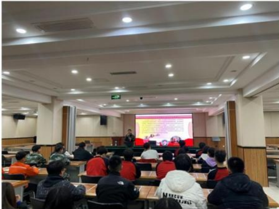
图 1 学生德育工作活动

学生心理健康教育；既有学生生理健康知识，又有校园安全防护，更有工匠精神和职业理论教育，受到了学生的欢迎。