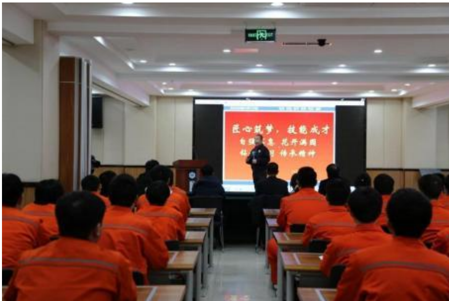
图9 “匠心筑梦 技能成才”讲座

在校园文化建设方面，充分利用板报、橱窗、LED显示屏等校园文化载体宣传学生作品，按时更换橱窗和板报内容，定期进行精神文明班级和宿舍评选活动；积极开展“雷锋月”、“敬老月”、“校园文化节”、“技能大赛节”、“企业文化进校园”等各种活动，校园文化丰富多彩。