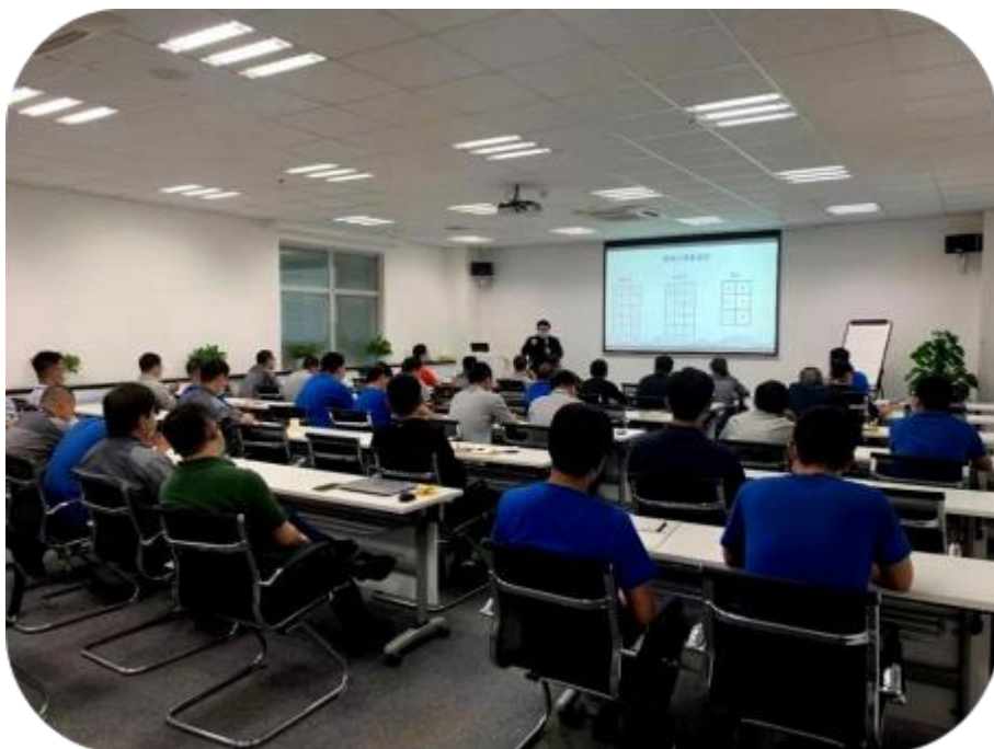
图 12 企业“新型学徒制”培训