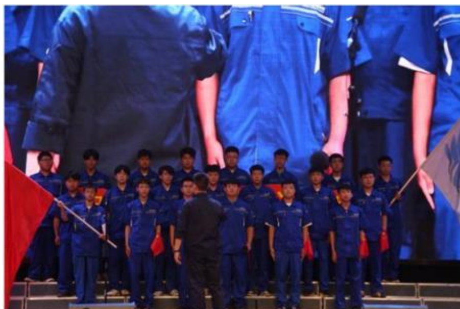
图 6 “传承五四薪火 礼赞盛世中华” 班级合唱比赛 2