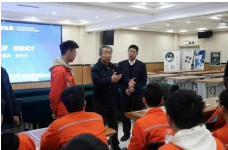
图 10 国家技能大师张东元与学生交流

根据学校工作计划，学生处每学期都会组织学生开展校园青春风采大赛、拔河比赛、篮球比赛、演讲比赛、朗诵比赛、国学诵读等系列活动。通过活动，弘扬健康向上的校园文化，丰富同学们的课余文化生活，发掘更多学生的潜力。如表 4 所示：