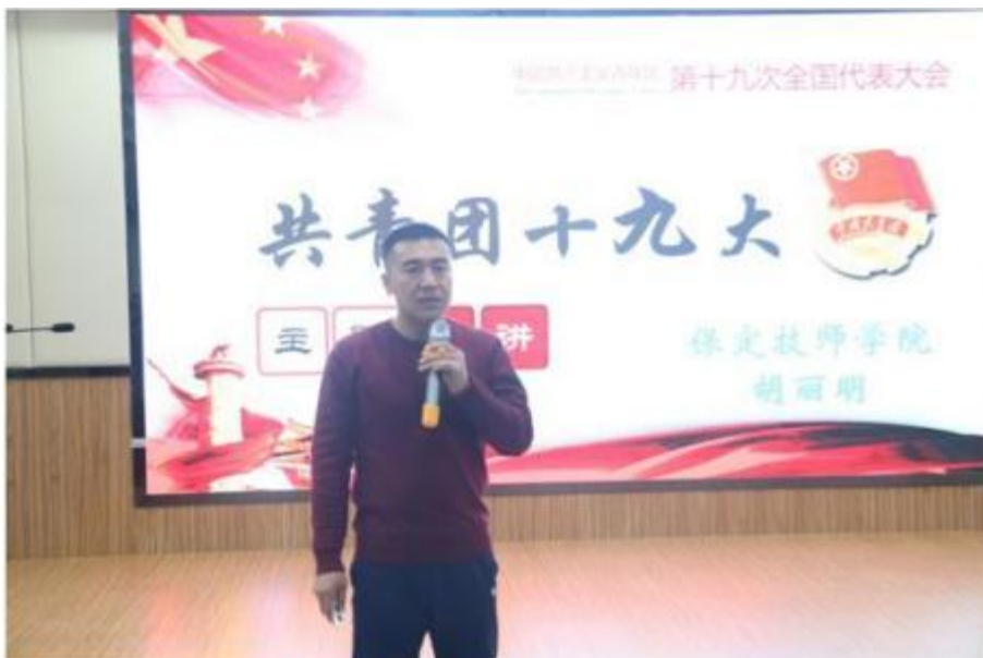
图 2 思政大讲堂活动