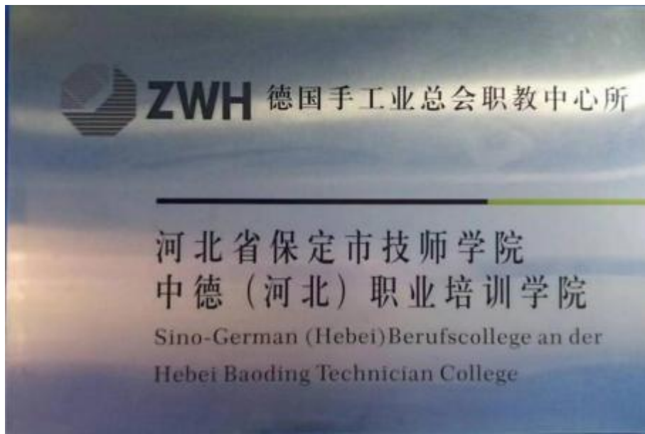
图 11 中德河北职业培训学院牌匾

新材料等多个领域，旨在培养具备高度专业技能和创新精神的工匠人才。学院还与多家知名企业建立了合作关系，为学员提供了丰富的实践机会和就业资源。