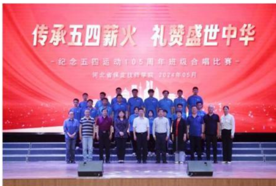
图 5 “传承五四薪火 礼赞盛世中华” 班级合唱比赛 1

传唱五四爱国精神，弘扬自强不息的民族传承，礼赞祖国 75 载盛世华章，表达了青年学生对党的忠诚、对祖国的热爱以及对学院的真挚情感。