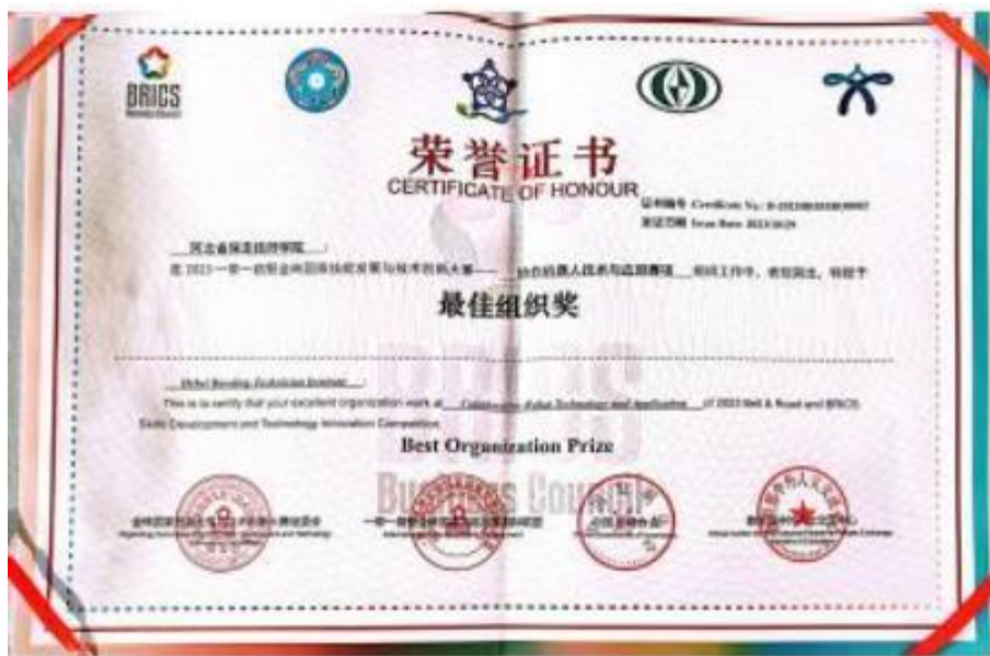
图 17 一带一路最佳组织奖