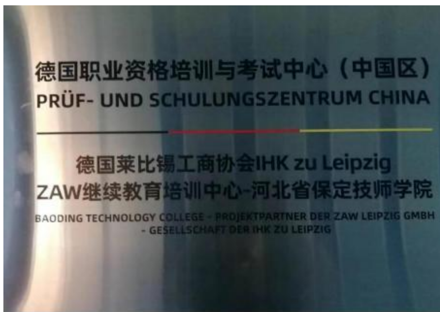
图 19 IHK 考试中心牌匾

保定技师学院中德项目的人才培养质量和考核标准得到了德国莱比锡工商业协会的认可，在保定技师学院挂牌成立了德国工商协会 IHK 海外考试中心。中心对接德国企业与德国专家教学资源，根据前期中德机电一体化合作班的办学成果，在考试中心按照德国工商协会双元制标准进行理论和实训课程的相关培训、考核及颁发证书，组织实施考试活动，成为区域性的德国考试中心，促进区域中德职业教育合作及人才培养水平的提升。