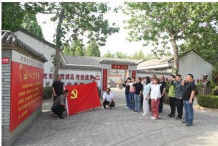
图 4 党员活动

愿服务等，引导党员教师在学生管理、教学科研等工作中发挥先锋模范作用，为学生树立榜样，激励学生积极进取。