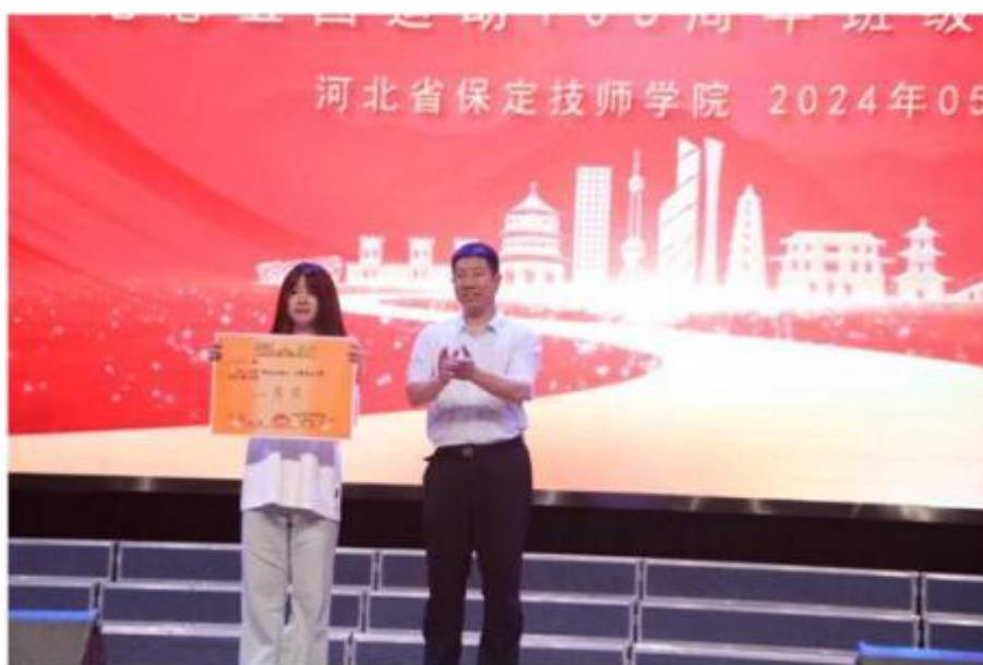
图 8 “传承五四薪火 礼赞盛世中华” 班级合唱比赛颁奖

通过发挥活动育人、文化育人作用，引导广大学生在“爱国、进步、民主、科学”的伟大五四精神的激励下学好技能、脚踏实地，为推进学院高质量发展和实现中华民族伟大复兴而奋斗。