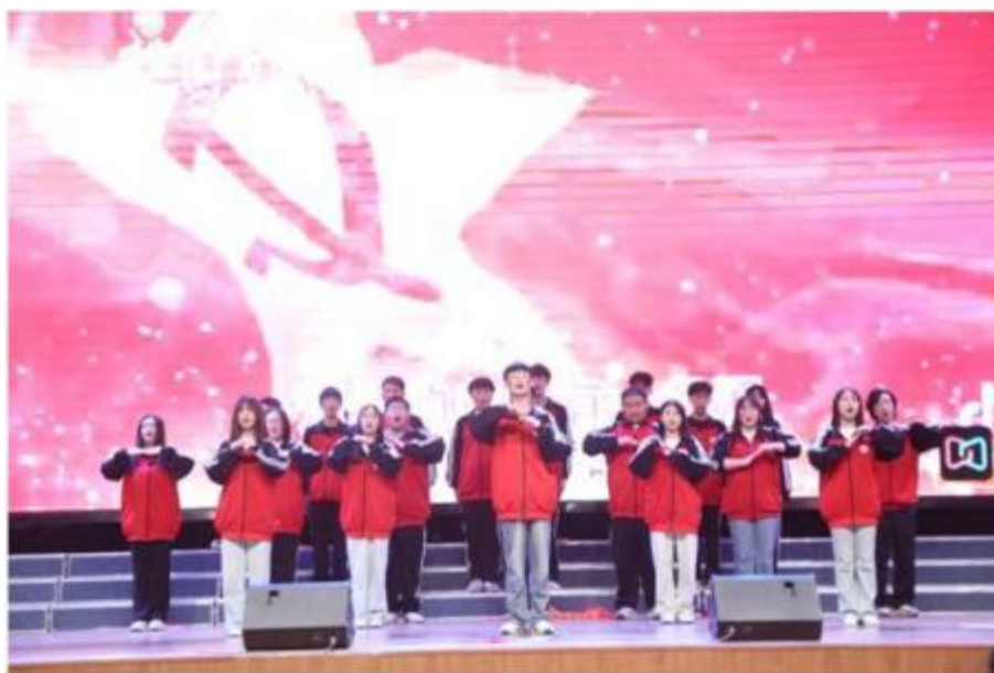
图 7 “传承五四薪火 礼赞盛世中华” 班级合唱比赛 3