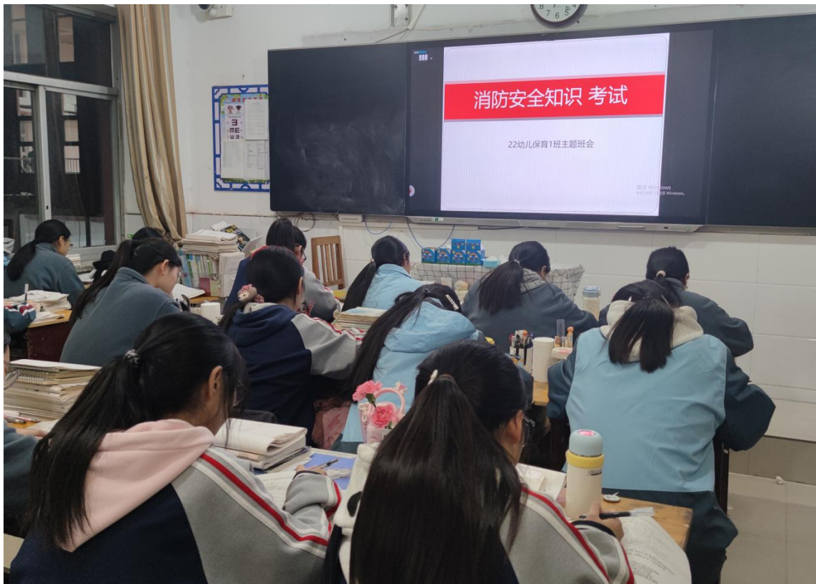
图 4 开展消防安全知识考试

在管理机制上，构建校、班两级管理网络，明确各级管理职责，确保工作组织有序、执行高效。严格落实文明行为规范，强化班级日常管理，建立一生一档。每日坚持晨午晚检，及时掌握学生健康状况。高度重视学生心理健康，心理教师定期授课，开展心理健康月等活动，如对 24 级全体学生进行心理测量，深入了解学生的心理健康状况，并根据测量结果开展有针对性的心理主题班会和讲座，帮助学生树立正确的人生观、价值观，培养积极向上的心态，增强心理调适能力，引导学生获得成长动力。