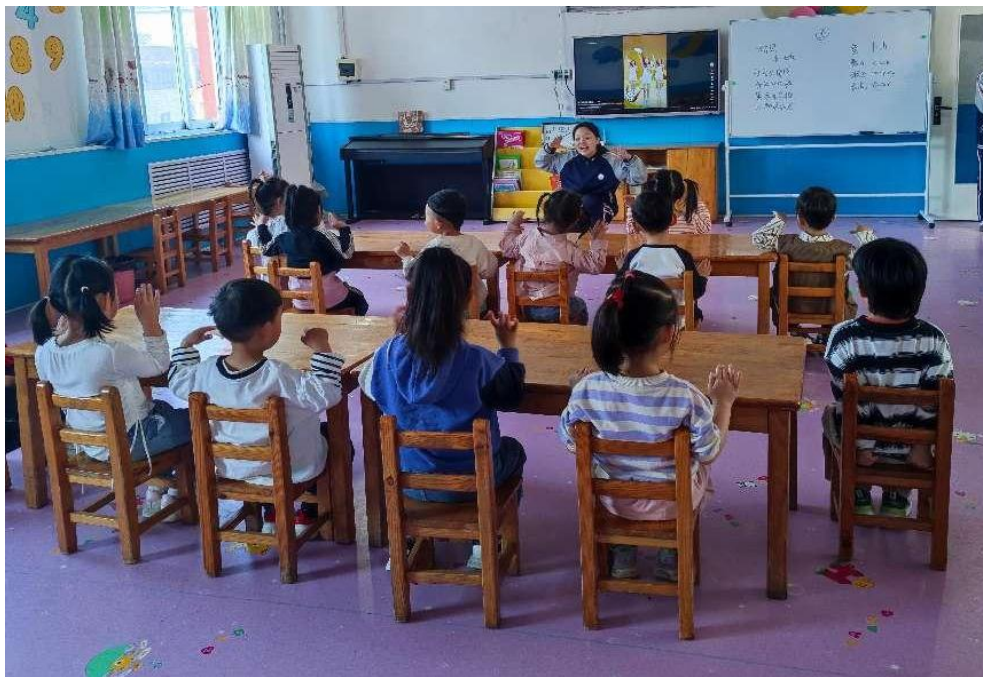
图 6 幼儿保育专业学生在小脚丫幼儿园实习