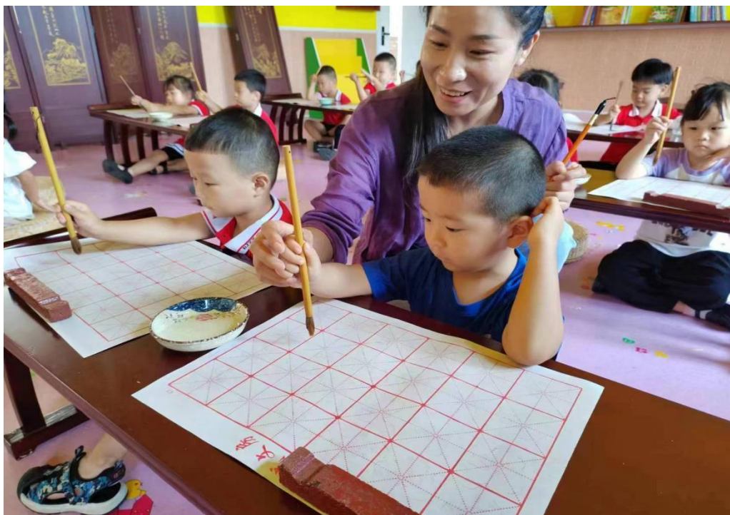
图 14 学校教师到小脚丫幼儿园培训

优化的专业结构，积极的产教融合，结合当地经济发展，提高专业建设水平，走专业化发展之路。加强教师培训，落实专业教师下沉到企业进行每年三个月实习培训。