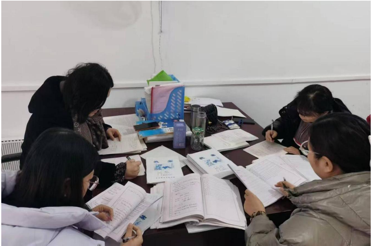
图 11 教师发展中心检查教案