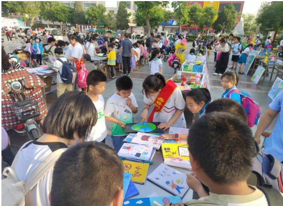
图 17 幼教学生在为小朋友介绍作品

2024年5月24日下午，蠡县职教中心在蠡县法治广场举办书画作品展，包括绘画作品、绘本、手工三部分内容。绚烂多彩的手工艺品，中职学生与教师的友好与热情，吸引了各级各类社会人士的驻足参观了解，得到了广大人民群众的热情关注。