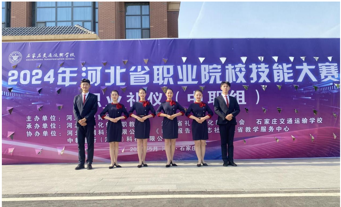
图 8 2024 年河北省职业院校技能大赛职业礼仪赛项