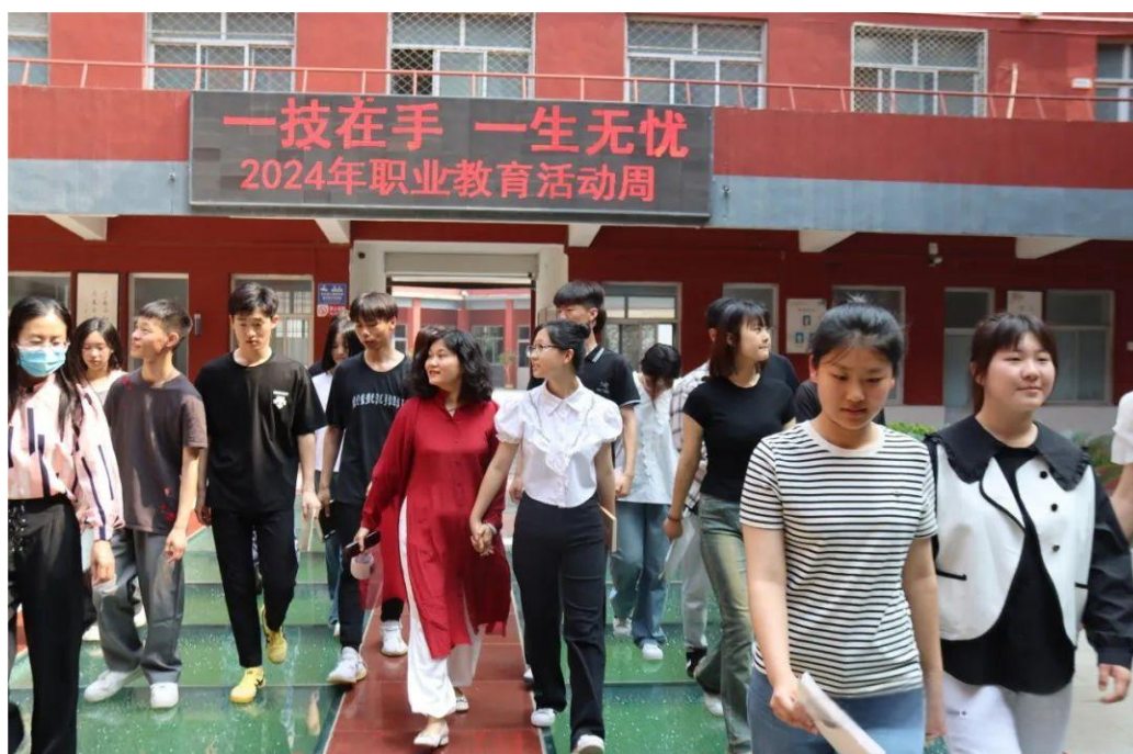
图 13 职业教育活动周家长开放日

5月22日上午，蠡县职教中心在实训楼三楼会议室举办2024年职业教育活动周启动仪式暨校园开放日活动，活动期间，学校全面开放校园，邀请学生家长、企业代表、社区居民等走进校园。在讲解员的带领下，来访学生、家长参观了学校环境、各专业实训室、餐厅、宿舍、操场，近距离感受学校深厚的人文底蕴和蓬勃向上的生命力。各位家长和同学深入了解了学校的校园环境、办学特色、师资力量、课程设置、学生活动等各方面的情况，感受到了学校的教育氛围和文化底蕴。