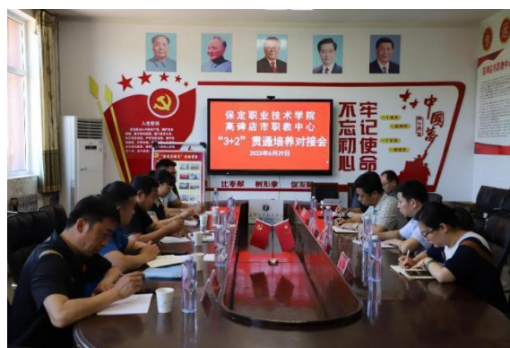
(上图为学校和联办校中高职培养对接)

2.2.2 课程建设质量。 一是开展好中高职人培方案和课程衔接工作。实行“3+2”贯通培养双高计划：丰富开展学生活动，鼓励学生参加学校组织的各类社团、竞赛、活动，从德智体美劳多方面锻炼能力、提升素养，培养“高素质”人才；深入研讨“3+2”中高职贯通培养人才培养方案，加强与高职院校的交流对接，共同制定人才培养方案，合理设置课程，强化技能训练，积极参加各级技能大赛，培养“高技能”人才。五年磨一技：中职重基础、强素质、提能力；高职重技能、强专长、张个性。通过中高职真正意义的贯通培养，五年后学生的核心素养将得到大幅提升，增强学生就业、创业、创造、创新能力。二是优化课程体系建设。