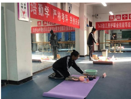
(上图为 1+X 证书幼儿保育专业学生考试照片)