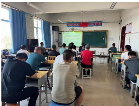
(上图为电工培训照片)

3.2 服务乡村振兴。 依托电子商务产教融合基地，在企业专家的参与下，充分发挥“电商工作室”职能，开展电商人才助力乡村振兴品牌活动，将课堂学习和乡村振兴实践紧密结合起来，厚植爱农情怀，练就兴农本领，在乡村振兴的大舞台上建功立业。