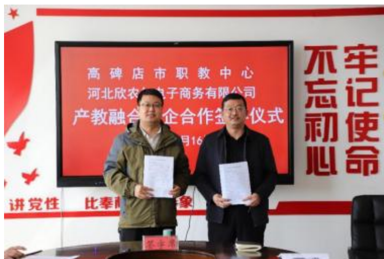
产教融合校企合作签字仪式

6.2 现代学徒制开展情况。 与河北欣农仁电子商务有限公司合作中，校企联合制定培训方案，面向电子商务专业学生推行新型现代学徒制人才培养模式。学生与企业签订学徒培养协议，明确双方权利义务，学生身份转变为企业准员工，增强了人才培养的针对性与稳定性。人才培养上，打破传统教学模式，构建“学校课程学习 + 企业岗位实践”交替进行的工学结合课程体系。依据企业工作安排与岗位技能成长规律，合理调配学生在校学习与在企实习时间，确保理论知识与实践技能学习相互促进、螺旋上升。第一学年，在校学习专业基础课程，赴企业进行为期两周的认知实习，熟悉企业生产环境与工艺流程；第二学年，根据岗位技能需求，分模块在校进行专项技能学习，随后到企业进行岗位实践，由企业师傅手把手指导，实现学中做、做中学。校内选拔一批教学经验丰富、专业技能扎实的骨干教师担任学业导师，负责学徒在校期间的理论教学、学业指导与职业规划。同时，企业选拔技术精湛、品德高尚的资深技术人员担任企业导师，承担学徒在企业实习期间的岗位技能培训、实践操作指导以及职业素