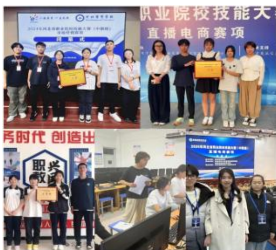
我校师生备战电商技能比赛并获奖

养培育。双导师分工协作、定期沟通交流，共同制定学徒培养计划、考核标准，为学徒成长成才保驾护航。目前，已组建了一支高素质的 12 人双导师团队。为确保学徒所学知识与企业岗位需求紧密匹配，实现从学校到企业的无缝对接。双导师团队重构课程体系，开发出《网店装修》在线精品课程，并于 24 年 9 月在慧职教 MOOC 平台上线开课，目前开课 2 期，选课人数 3000 余人，涉及 162 个学院所属单位，累计互动日志 21 万多条，辐射广、效能高，为中高职学校的电商专业学生、当地电商从业人员和社会需求人员提供在线教学，为农民增收贡献更多职中智慧和力量。电子商务专业通过引入新型现代学徒制人才培养模式，学生在专业技能掌握、实践操作能力方面都取得了显著的进步。2023-2024 学年度，电子商务专业共有九支队伍 28 人次晋级到技能大赛的省级比赛中，并斩获省一等奖三个，省二等奖两个，省三等奖四个。充分展现了他们在新型学徒制培养中收获的扎实技能功底。