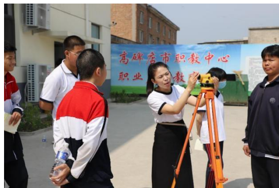
(上两图为职业启蒙教育开展现场)

3.4 具有本校特色的服务。 强化人才培养“一个目标、两个面向、三项原则、四个突出”。一个目标：培养目标是造就一大批服务于生产第一线的高素质的应用型人才。两个面向：面向社会、面向人才市场，服务于经济建设和社会发展的需要。三项原则：应用型人才培养就是要强化“基础性、应用性、实践性”，办出应用型特色。四个突出：突出技术应用能力本位的教育思想，突出“教师为主导、学生为主体”的教学理念，突出学生全面素质的提高，突出可持续发展能力和创新能力的培养。与高碑店、白沟电商协会，河北新农仁电子商务有限公司、河北初色传媒等一批有影响的电商企业合作，校企共建 5700 平米电子商务产教融合基地，建立“校中厂”，把学生的学习和技能培养放到企业中进行，实施“理论+实训+项目运营”的双主体办学、深层次合作的育人模式。